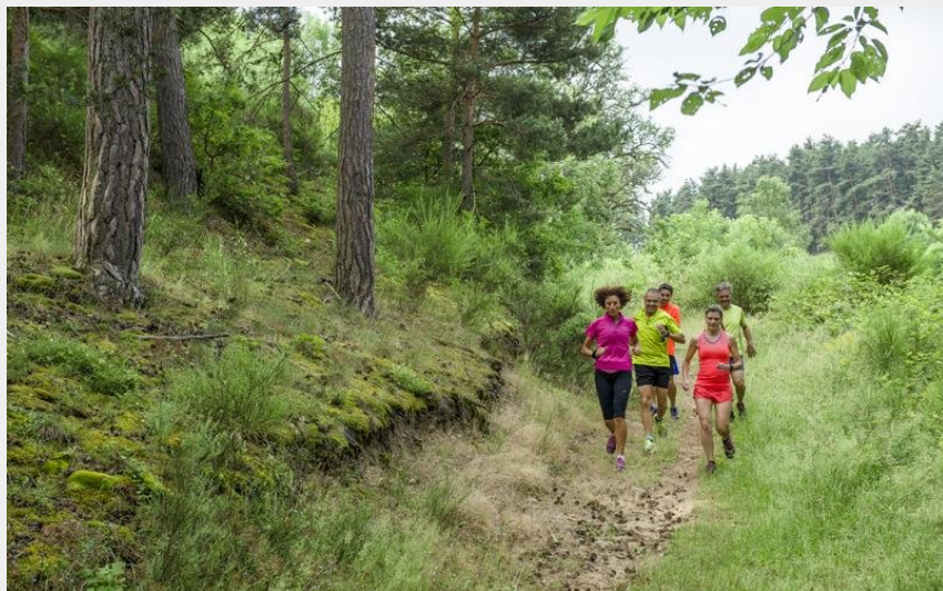
Traillleurs dévalant les pentes (OT Loire Semène)