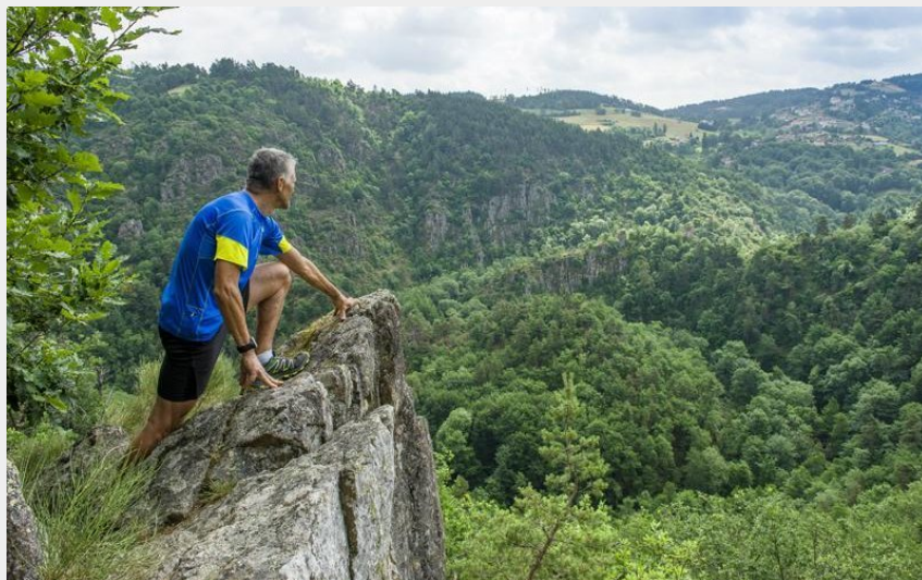
Contemplation au sommet