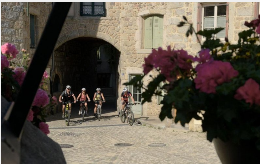
Dans le village en VTT