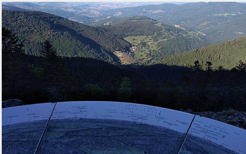
Pause panoramique (Office de Tourisme du Haut-Pays du Velay)