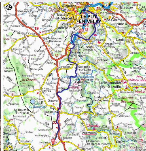
Le charme de la Via Velay vu d'en haut (Agglomération du Puy-en-Velay)

Découvrez l'ancienne ligne de chemin de fer entre le Puy-en-Velay et Langogne, réaménagée en Voie Verte jusqu'à Landos. Une balade riche en points de vue et en ouvrages d'art qui vous conduira au sur les balcons de la vallée de la Loire.