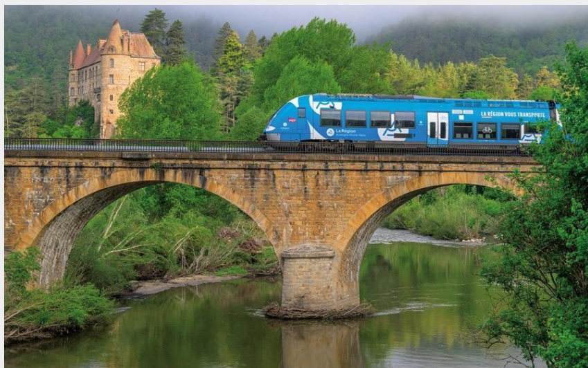
Le train TER au château de Lavoûte-sur-Loire (Velay Attractivité)