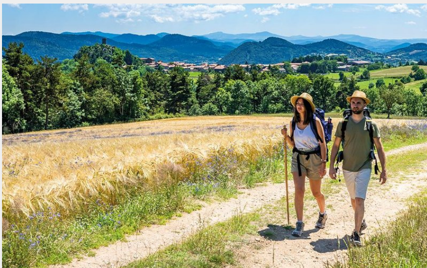
Sur le GR 3