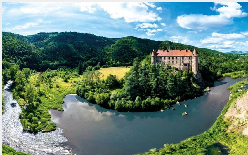
Château de Lavoûte-Polignac (Velay Attractivité)