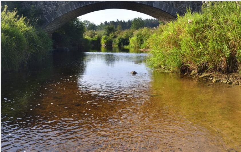
La Gouise (Ch. Bertholet)