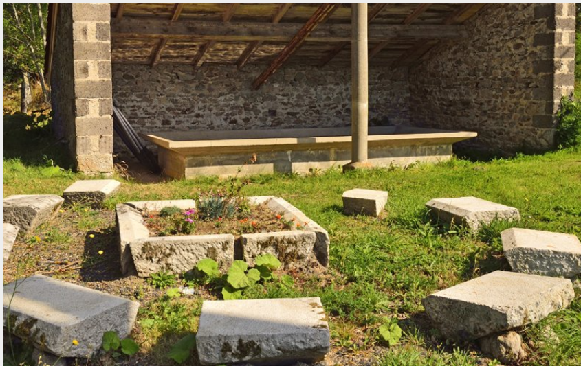
Lavoir de Ranchoux (P Bousseaud)