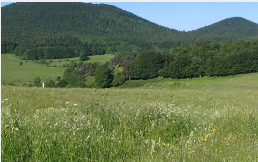
Les monts Breysse (JN Borget)