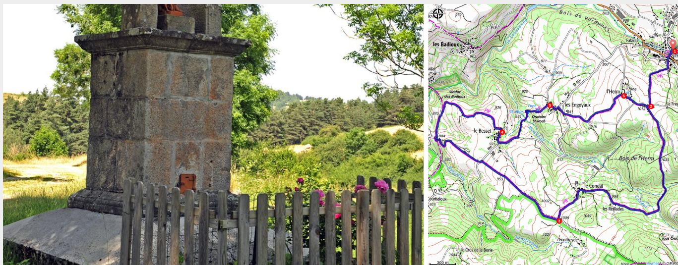
Oratoire Saint Roch (Christian BERTHOLET)

Un four banal, une assemblée, un bachat (abreuvoir), une croix, un métier à ferrer, voici planté le décor typique du « coudert » (place commune) que vous trouverez dans les hameaux traversés par cette randonnée.