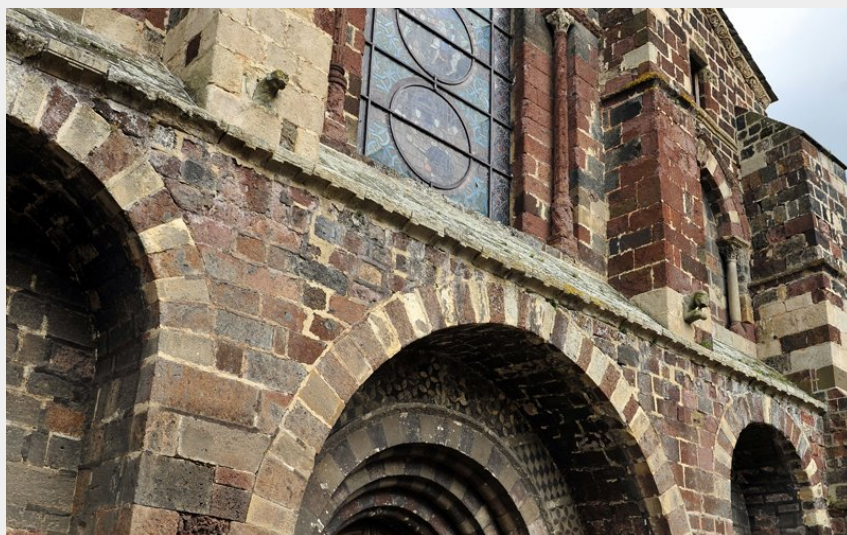
Eglise abbatiale Saint Théofrède (Christian BERTHOLET)